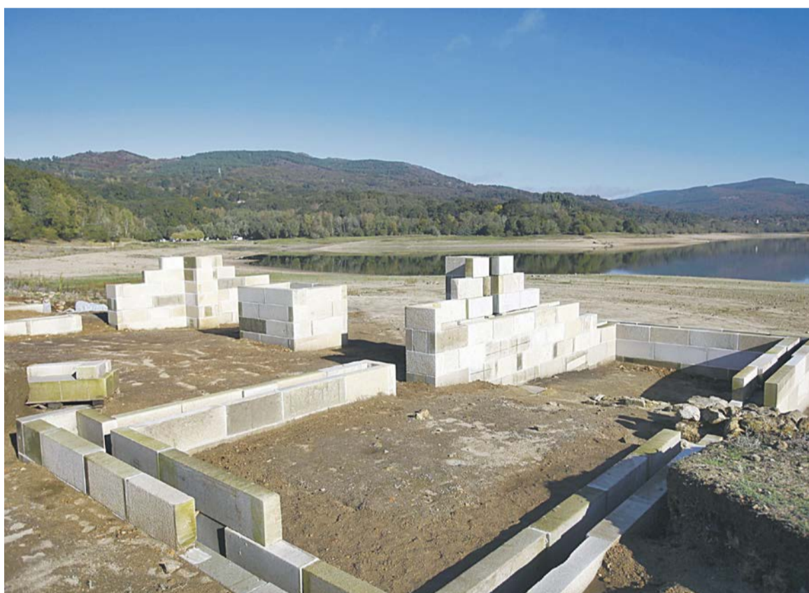
Tras la excavación, los operarios trabajan ya en la reconstrucción de la puerta Praetoria.