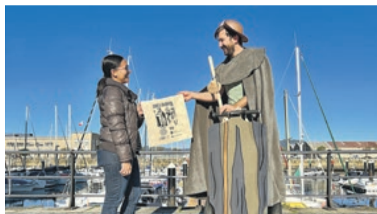
Uno de los personajes en plena campaña promocional en Vigo.

dador pudieron conocer, de la mano de tres personajes caracterizados de romano, peregrino y ciclista, la oferta cultural, natural y patrimonial que ofrece el territorio, vertebrado por el itinerario de San Rosendo o la Raíña Santa, que une Santo Tirso-Braga y Ourense con Santiago. La campaña, que persigue captar visitantes en mercados de proximidad, está enmarcada en las acciones aprobadas para este año por la asociación turística de 14 concellos que preside el Inorde y que cuenta con el apoyo de la Axencia de Turismo de Galicia. ■