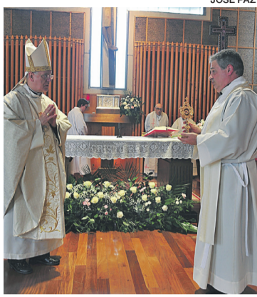
La entrega, ayer en Cristo Rey.