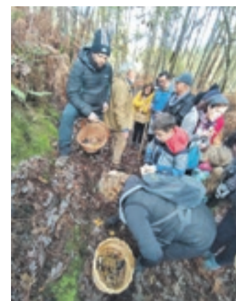
Salida micológica en Lobios.

Hoxe, felizmente, mudaron moito as cousas, porque a miña “aventura” foi publicada en 1992 no número 9 da Trabe de Ouro, a revista de Méndez Ferrín, e, deseguido, aquel mesmo ano, os concellos de Celanova e Santo Tirso asinaban un acordo de irmandade que se anova todos os anos e do que este se celebrou o seu trinta aniversario. E eu, para referendar o meu compromiso co personaxe e a historia, promovín no 2007 dende a Xunta de Galicia e co apoio do Ministerio de Medio Ambiente o “Camiño Natural de San Rosendo”, quedando executado o tramo entre a fronteira da Portela do Home en Lobios e a cidade de Ourense. E agora temos a Asociación de Amigos do Camiño de San Rosendo e da Raíña Santa, co claro obxectivo de darlle o empurrón final a este engaiolante proxecto de reivindicación dun camiño histórico que nos afunde nos alicerces da época máis frutífera e gloriosa de Galicia: a de Xelmírez, o románico e o Mestre Mateo.