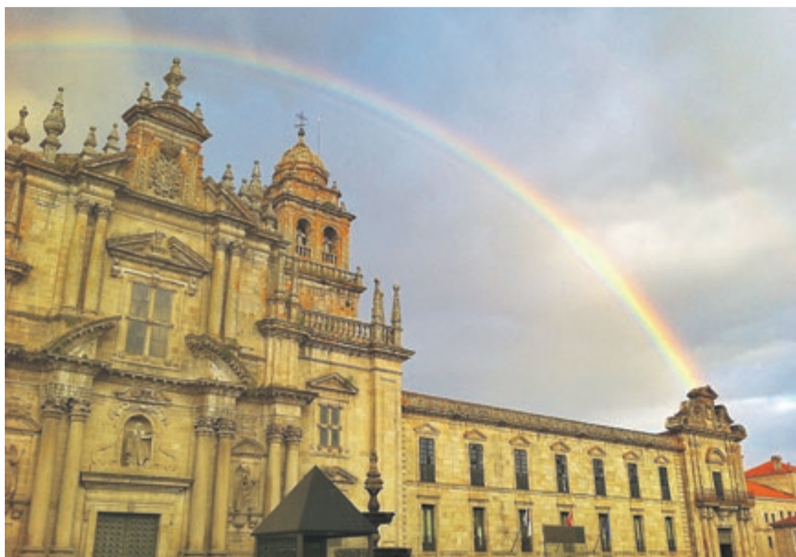
Fachada principal del monasterio de San Rosendo, en Celanova.

Santo Tirso... claro. Todo comezou alí, hai máis de mil anos, nesta gran vila sita nas ribeiras frescas e recendentes que baixan, ateigadas de hortas e bacelos, ata o río Ave, un lugar privilexiado entre as cidades de Porto e Braga. Aló fun eu tamén, no mes de setembro de 1990, hai xa trinta e dous anos, procurar o berce de Rosen-