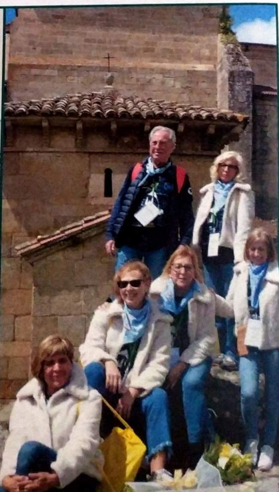
Equipo de guías que colaboró organizando las visitas turísticas por la provincia para los acompañantes de los congresistas