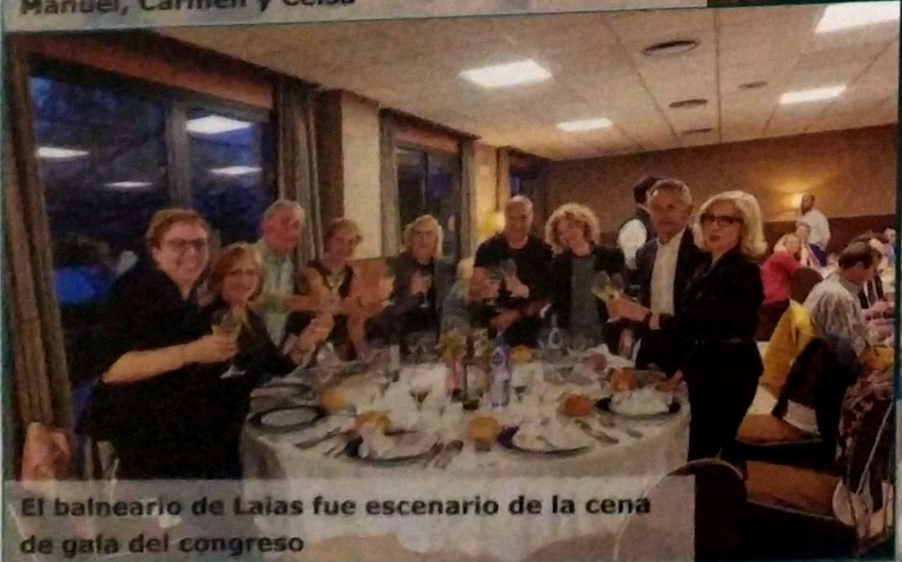
El balneario de Laias fue escenario de la cena de gala del congreso