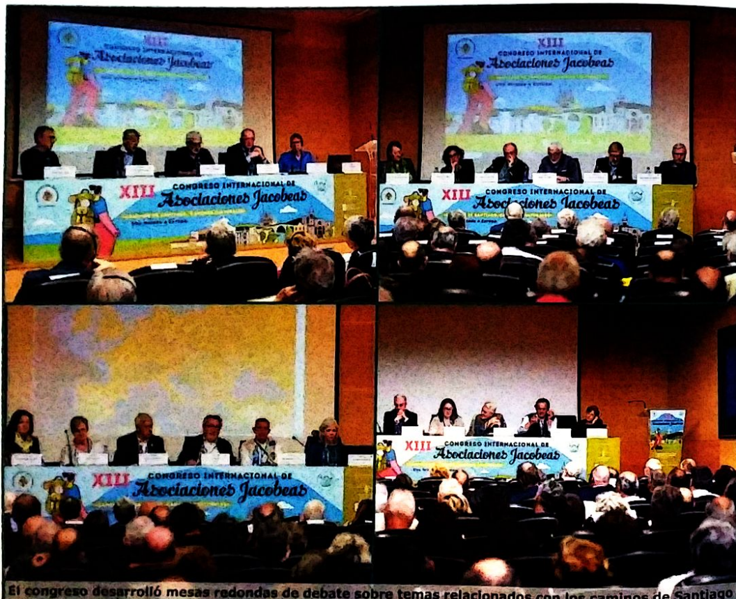
El congreso desarrolló mesas redondas de debate sobre temas relacionados con los caminos de Santiago.

Esta cita internacional tuvo también espacio para la exposición de comunicaciones por parte de miembros de estas asociaciones jacobeanas e instituciones. De este modo, se desarrollaron 20 presentaciones de 10 minutos cada una, en la que los relatores abordaron temas muy diversos, como puede verse a continuación.