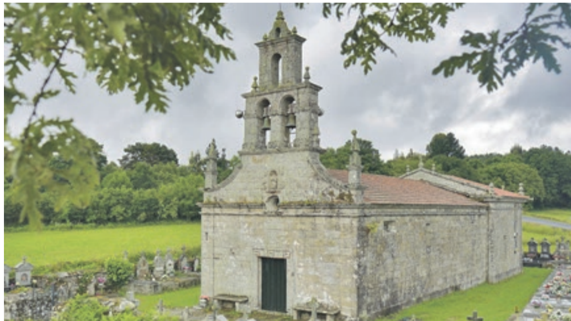
Iglesia de Ourille, en Vereia.

en su punto más alto, proporcionando una experiencia mayor a los visitantes. A pocos metros de esta plataforma, un columpio añade un toque lúdico y atractivo, permitiendo disfrutar del paisaje de una manera única. Este mirador complementa el turismo rural de la zona y es fácilmente accesible desde Sabucedo, en la parroquia de Ourille. El Concello de Vereia ha desarrollado desde ese punto la Ruta do O Briñal y de O Ruxidoiro, con recorridos de alrededor de los 10 kilómetros cada una de ellas que discurren por antiguos caminos, entre robles, carballos y castaños, ofreciendo vistas espectaculares del valle del Ourille y otros