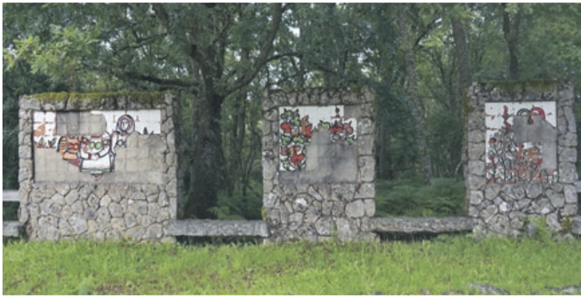
Antigua fábrica de papel en proceso de restauración.

En la frontera con Portugal, combina un contacto con la naturaleza exuberante y con rica historia, ofreciendo desde asentamientos históricos y rutas de peregrinos hasta llegar al Parque Natural de Peneda Gêres.