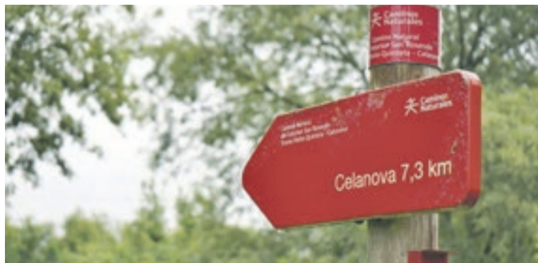
Tramo del camino natural de San Rosendo.

en su punto más alto, proporcionando una experiencia mayor a los visitantes. A pocos metros de esta plataforma, un columpio añade un toque lúdico y atractivo, permitiendo disfrutar del paisaje de una manera única. Este mirador complementa el turismo rural de la zona y es fácilmente accesible desde Sabucedo, en la parroquia de Ourille. El Concello de Vereia ha desarrollado desde ese punto la Ruta do O Briñal y de O Ruxidoiro, con recorridos de alrededor de los 10 kilómetros cada una de ellas que discurren por antiguos caminos, entre robles, carballos y castaños, ofreciendo vistas espectaculares del valle del Ourille y otros