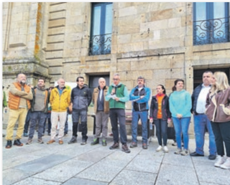
① Un momento do acto reivindicativo en Celanova.