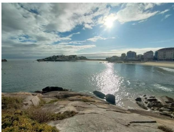
San Cibrao, pueblo marinero en la ruta.

Ruta corta que no llega a Santiago sino que se articula alrededor de la ría de Betanzos y el pueblo de Sada , con alternativas de 6 y de 14 kilómetros. Es un itinerario que destaca sobre todo por la riqueza de su patrimonio arquitectónico y religioso.