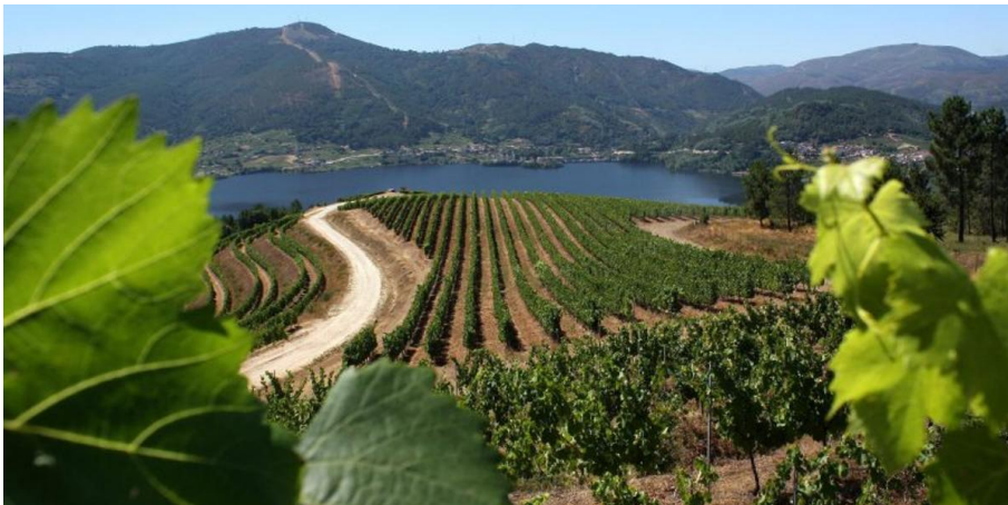
Viñedos en O Ribeiro, con el Miño al fondo.

El Camino del Mar es una ruta de peregrinación a Santiago ampliamente documentada y que tiene un importante poso histórico. Parte de Ribadeo y recorre la costa lucense por sus pueblos marineros, para después entrar en Ortegaleira, donde están los acantilados más altos de Europa y el epicentro religioso de San Andrés de Teixido . Continúa hasta Ferrolterra y ya enlaza hacia Santiago con el conocido Camino Inglés.