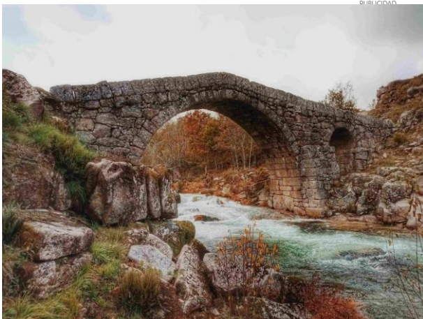
Puente en la ruta de A Geira.