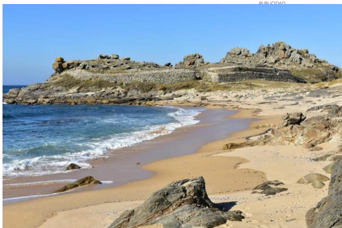
Castro de Baroña, en Porto do Son.