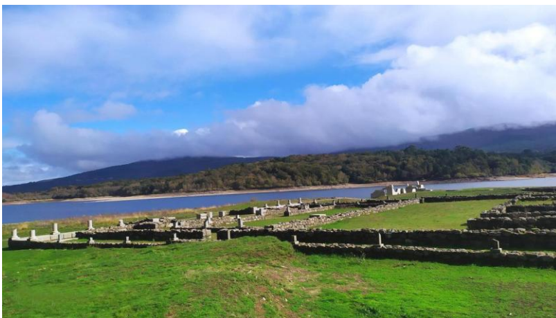
Aquis Querquennis en Bande.

Otra de las rutas históricas que enlazaban Braga (Portugal) con Santiago y que se recuperó estos años con tres variantes diferentes para entrar en Galicia. Es un itinerario marcado por la pegada romana y por tres características principales: cultura del vino, termalismo y naturaleza. Está muy vinculado al Camino Portugués.