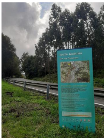
Cartel del itinerario das Mariñas o Mariñán.

El Camino de Muros-Noia parte de las localidades costeras de Muros y Porto do Son , siguiendo la ría hacia el interior hasta juntarse en Outes y cruzar el Tambre en el emblemático puente de Ponte Nafonso . Espectacular por sus paisajes y sus vistas, también tiene importante patrimonio cultural antes de adentrarse en Santiago por Bertamiráns. Reconocido desde 2020.