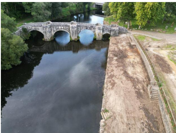
Puente de Brandomil, en Zas

Certificado por el Cabildo de la Catedral de Santiago en 2019 , es una de las rutas de peregrinación más antiguas, que sale de Braga (Portugal) y sigue la antigua Geira de la Vía Romana XVIII . Goza de un enorme valor paisajístico y cruza O Ribeiro, ya que era el trayecto seguido para transportar el vino de esa zona de Ourense a Santiago, entrando en la capital por el Arco de Mazarelos , la 'porta do viño' que todavía conserva en sus piedras relieves de racimos.